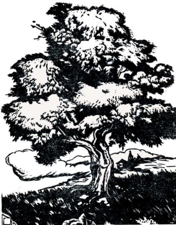
CASTIÑEIRO , grabado en linóleo de Xaime Prada na primeira edición de Bebedeira , no ano 1934.

Andan os paxaros, co medo, a chiar... (Do Xapón, mandaron castiros ananos para que os nenos poidan os niños pillar sen rubir ás gallas, sen engateñar, sen rachar as calzas... dende o mesmo chan!) Andan os paxaros, co medo, a chiar.