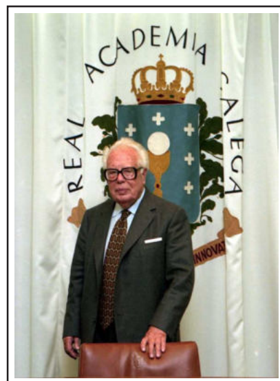
Francisco Fernández del Riego na Real Academia Galega.

Traballou arreo polo idioma e a cultura galega: foi membro do Seminario de Estudos Galegos, escribiu en moitos xornais e revistas, fundou a Editorial Galaxia, presidiu a Fundación Penzol, traballou na BBC, emisora inglesa, facendo programas en galego, foi membro e presidente durante catro anos da Real Academia Galega, recibiu as Medallas de Ouro de Galicia e a de Castelao.